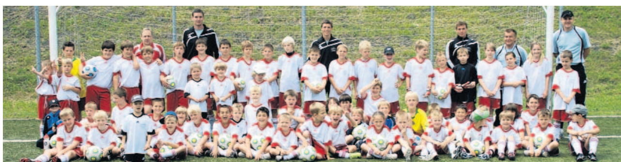
Motiviert bei der Sache: 68 Kinder waren beim ersten FCV-Sommerncamp dabei.

Fussball. – 68 Kinder, davon fünf Mädchen, nahmen am FCV-Camp teil. Am Mittwochnachmittag waren zusätzlich zehn handycaperte Kinder von der Tagesschule in Schaan mit dabei, welche bei einem Turnier in verschiedene Teams integriert wurden. In der Regel wurde am Vormittag Technik, Koordination und Laufschnelle trainiert, am Nachmittag fanden jeweils verschiedene